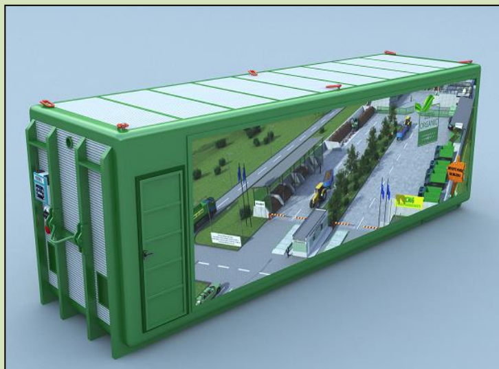
BF 6 BF/8 BF/10 BF/15

BF/6 BF/8 BF/10 mobilní BF/15 stacionární